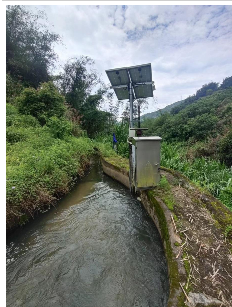
下泄流量口及监控设施

生态流量采用超声流量计计量，在下泄管安装超声波计量装置，数据实时采集并上传省监管平台以实现生态下泄流量在线监测；流量计计量系统包括：闸门开度，数据采集器、云数据处理与换算软件、数据转发软件，每15分钟上传1组流量数据支持一点多传，已接生态环境主管部门监控平台。